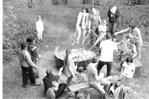
Familien der Markusgemeinde beim Grillen

Von Samstag, 30. September bis Dienstag, 3. Oktober findet unsere diesjährige Freizeit im Haus Donauversickerung bei Tuttlingen statt. Unser großes Haus liegt zwischen der idyllischen Landschaft der Schwäbischen Alb, dem Bodensee-Hegau und dem Naturpark Obere Donau (Luftkurort).